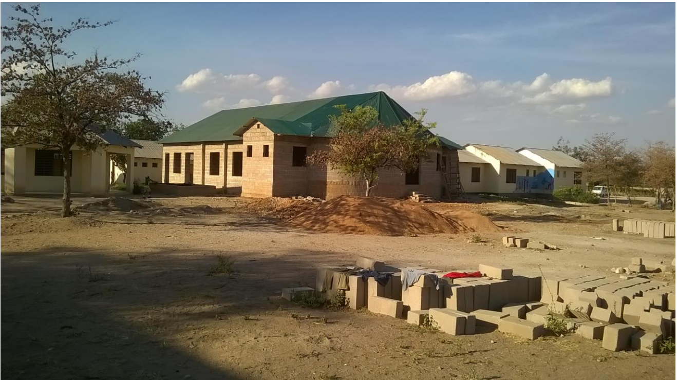
De nieuwbouw van de eetzaal bij de Dodoma Doven School, gesponsord door het Liliane Fonds- Nederland

Activiteitenverslag en financiële positie per 31 december 2015