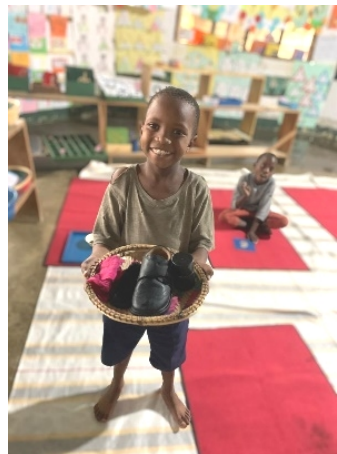
Trots op het resultaat!