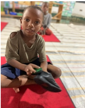
Montessori 'oefening uit het dagelijks leven': schoenen poetsen